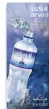
210x500 mm, uwypuklenie, wytłoczony relief