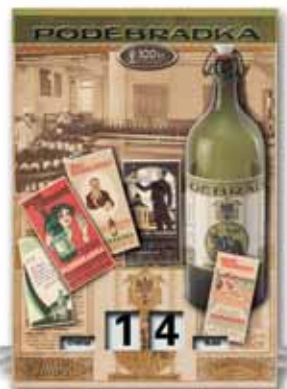
Tablica blaszana z wytłoczonym reliefem, druk ofsetowy, 300 x 430 mm, mechaniczny kalendarz