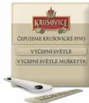
Kombinacja blaszanej tablicy i blaszanych paseszków z magnesem

Minimalna ilość pinesek jest 5.000 sztuk