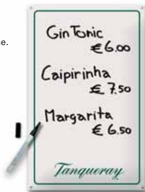
400x600 mm, 1 kolor, uwypuklenie