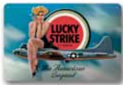
290x190 mm, uwypuklenie, wytłoczony relief