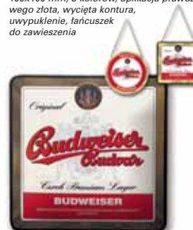
400x400 mm, 5 kolorów, aplikacja prawdziwego złota, uwypuklenie