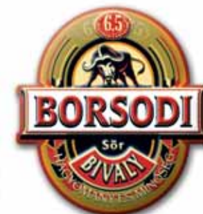
370x395 mm, uwypuklenie, wytłoczony relief, wycięty kształt