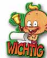
50x50 mm, druk ofsetowy, wycięty kształt