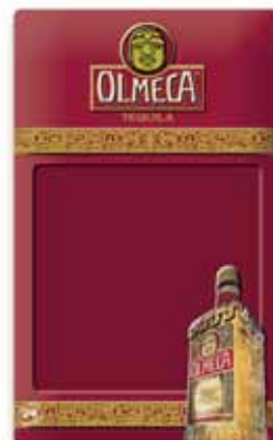
400x650, uwypuklenie, wytłoczony relief, matowy lakier do pisania kredą