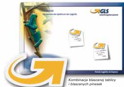
Kombinacja blaszanej tablicy i blaszanych pinesek