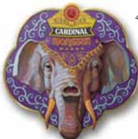
460x460 mm, 8 kolorów, wycięta kontura, uwypuklenie, ukryte zawieszanie