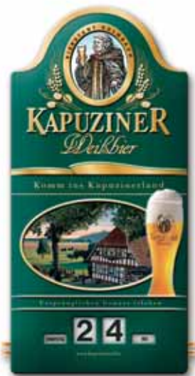
Tablica blaszana z wytłoczonym reliefem, druk ofsetowy z metalicznym złotym efektem, wycięty kształt, 300x600 mm, uwypuklenie, mechaniczny kalendarz