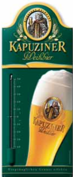
Tablica blaszana z wytłoczonym reliefem, druk ofsetowy z metalicznym złotym efektem, wycięty kształt, 300x750 mm, uwypuklenie, termometr

Tace do roznoszenia napojów z blachy grubości 0,5 mm, podrukowane ofsetem z obu stron, pokryte na wewnętrznym dnie warstwą lakieru antypoślizgowego, długi czas użytku, wysoka jakość i przystępna cena.