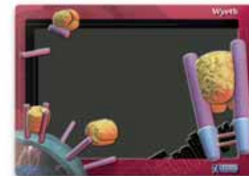
600x400, uwypuklenie, wytłoczony relief, matowy lakier do pisania kredą

Jeżeli nieposiadacie konkretnego wyobrażenia jak powinna wyglądać Wasza tablica, nasi graficy przygotowują projekt graficzny wraz z projektem wytłoczenia reliefu.