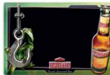
600x400, uwypuklenie, wytłoczony relief, matowy lakier do pisania kredą