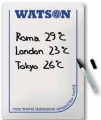
400x600 mm, 1 kolor, uwypuklenie

Po aplikacji matnego lakieru możecie na naszych tablicach blaszanych pisać kredą.