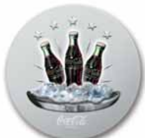
średnica 400 mm, uwypuklenie, wytłoczony relief, wycięty kształt