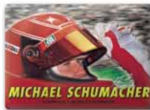
560x400 mm, uwypuklenie, wytłoczony relief