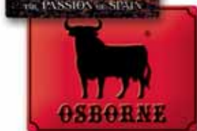
400x300 mm, uwypuklenie, wytłoczony relief