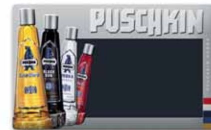
650x400, uwypuklenie, wytłoczony relief, matowy lakier do pisania kredą