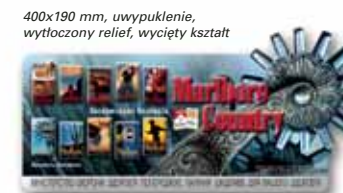
400x190 mm, uwypuklenie, wytłoczony relief, wycięty kształt