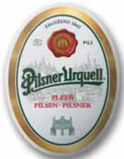
450x600 mm, 5 kolorów włącznie z prawdziwym złotem, wycięta kontura, uwypuklenie, ukryte zawieszanie

Wystarczy przesłać e-mailem obrazek podglądowy (prewkę)