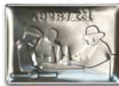
Wytłoczony relief od tyłu