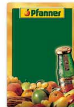
400x600, uwypuklenie, wytłoczony relief, matowy lakier do pisania kredą