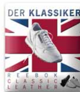
400x420 mm, uwypuklenie, wytłoczony relief