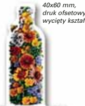
40x60 mm, druk ofsetowy, wycięty kształt