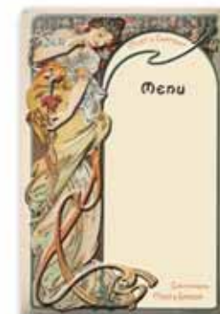
400x600, uwypuklenie, wytłoczony relief, matowy lakier do pisania kredą