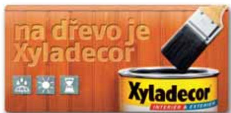
630x300, uwypuklenie, wytłoczony relief