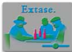
Nasz projekt wytłoczenia reliefu