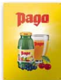
300x400 mm, 8 kolorów, uwypuklenie