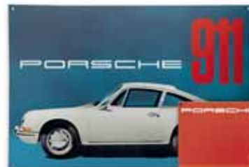
Coroczna edycja dla PORSCHE, limitowana seria 1.000 sztuk, 600x400 mm