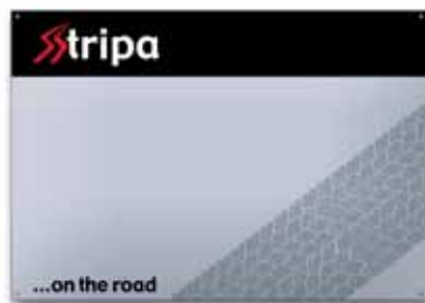
400x600 mm, 4 kolory, uwypuklenie