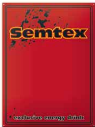
400x600 mm, 3 kolory, uwypuklenie