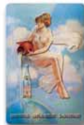
190 x 290 mm, uwypuklenie, wytłoczony relief