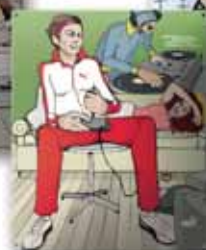
360x440 mm, 6 kolorów, uwypuklenie