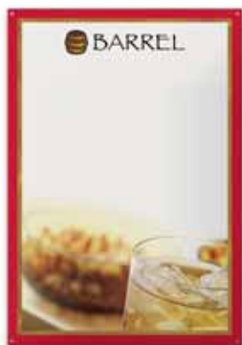
400x600 mm, 6 kolorów włącznie z prawdziwym złotem, uwypuklenie