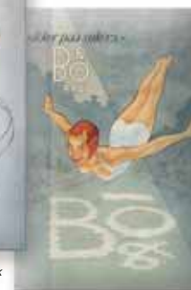
Limitowana seria 2.000 sztuk z okazji 75. rocznicy BANG & OLUFSEN, 400x600 mm