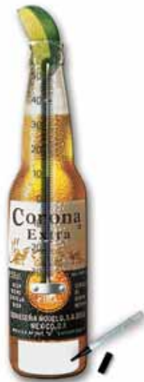
Emaliowana tablica, ceramiczny sitodruk, wycięty kształt, 150x600 mm, termometr