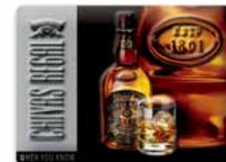
560x400 mm, uwypuklenie, wytłoczony relief