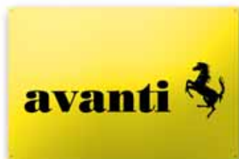
600x400 mm, 2 kolory, uwypuklenie